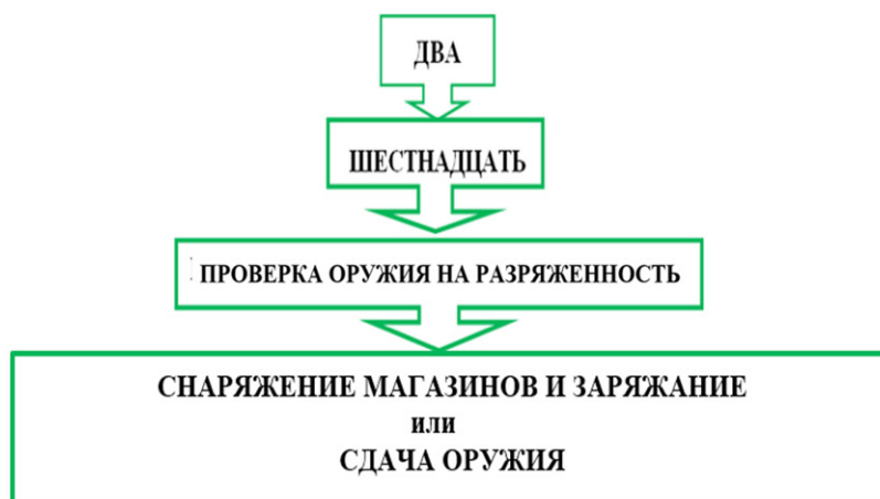
Рис. 1. Структура графической схемы единого алгоритма

стрельного оружия в дежурных частях территориальных органов МВД России происходит отработка не только действий сотрудника, заряжающего и разряжающего оружие. В это же время ответственное лицо повторяет алгоритм, направленный на предотвращение нарушений.